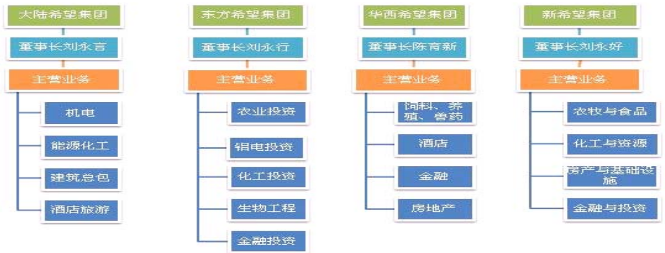
图表 1: 希望集团旗下业务布局图